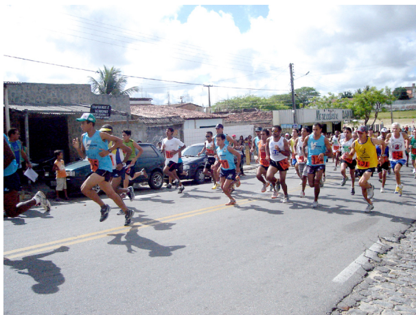
Imagem 08: Momento da largada - Pelotão masculino.

De acordo com Rosa (2007), a festa desencadeia uma intensa movimentação de culturas, cuja relevância, no cenário histórico-cultural do Brasil, manifesta-se numa prática que propicia a construção e afirmação de identidades, dentre outras características. Assim como a festa do 'Maior São João do Mundo' promove a afirmação e identificação